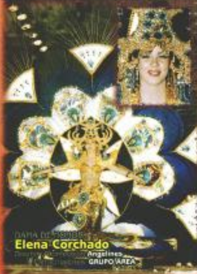
DAMA DE PASADORA Elena Corchado Diseño y confección: Angelines Patrocinadores: GRUPO AREA